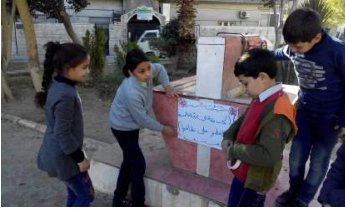
- حملة نظافة في الحدائق المجاورة للمدارس.