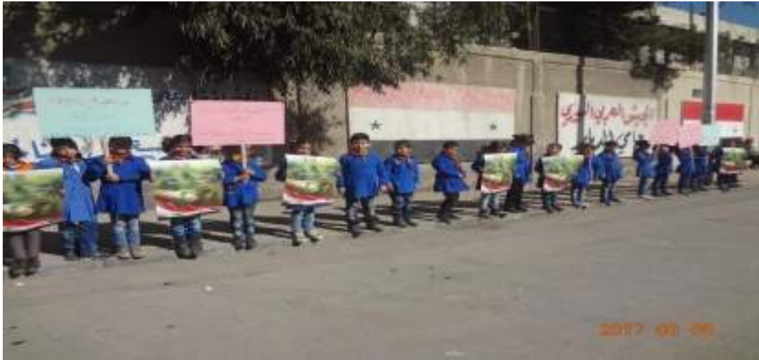
✓ معرض بيئي