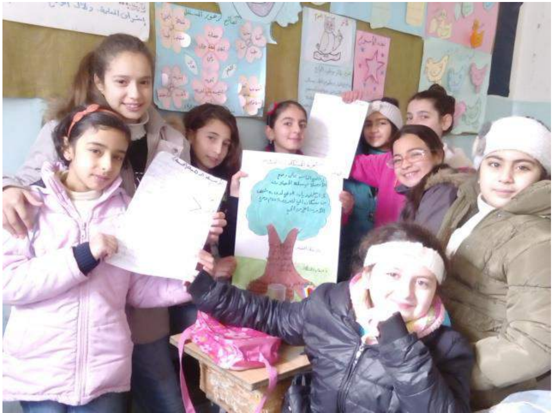
- تنفيذ رسوم وأعمال بيئية من قبل الطلاب المشاركين في المخيمات.