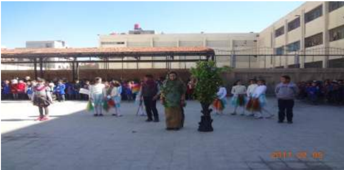
✓ نشاط تشجير