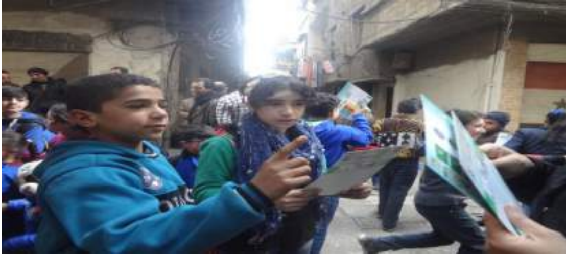
✓ مسرحية بيئية للأطفال