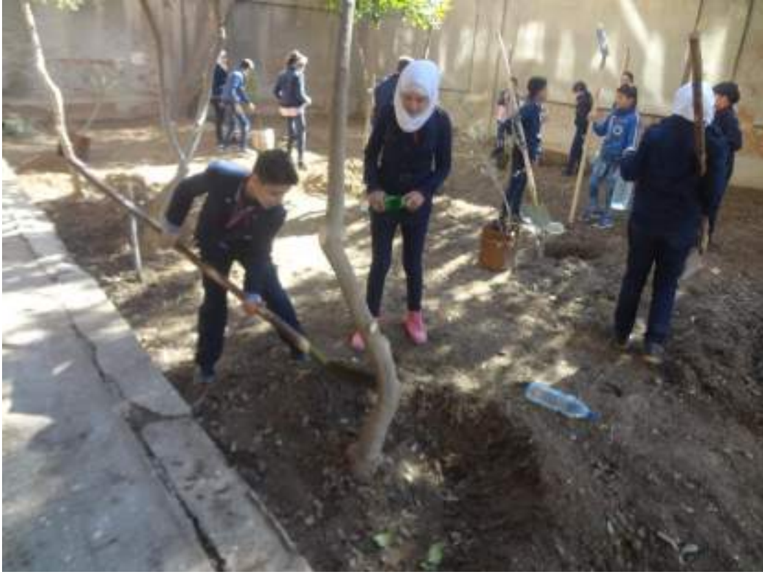
✓ حملة تشجير في حديقة الزاهرة